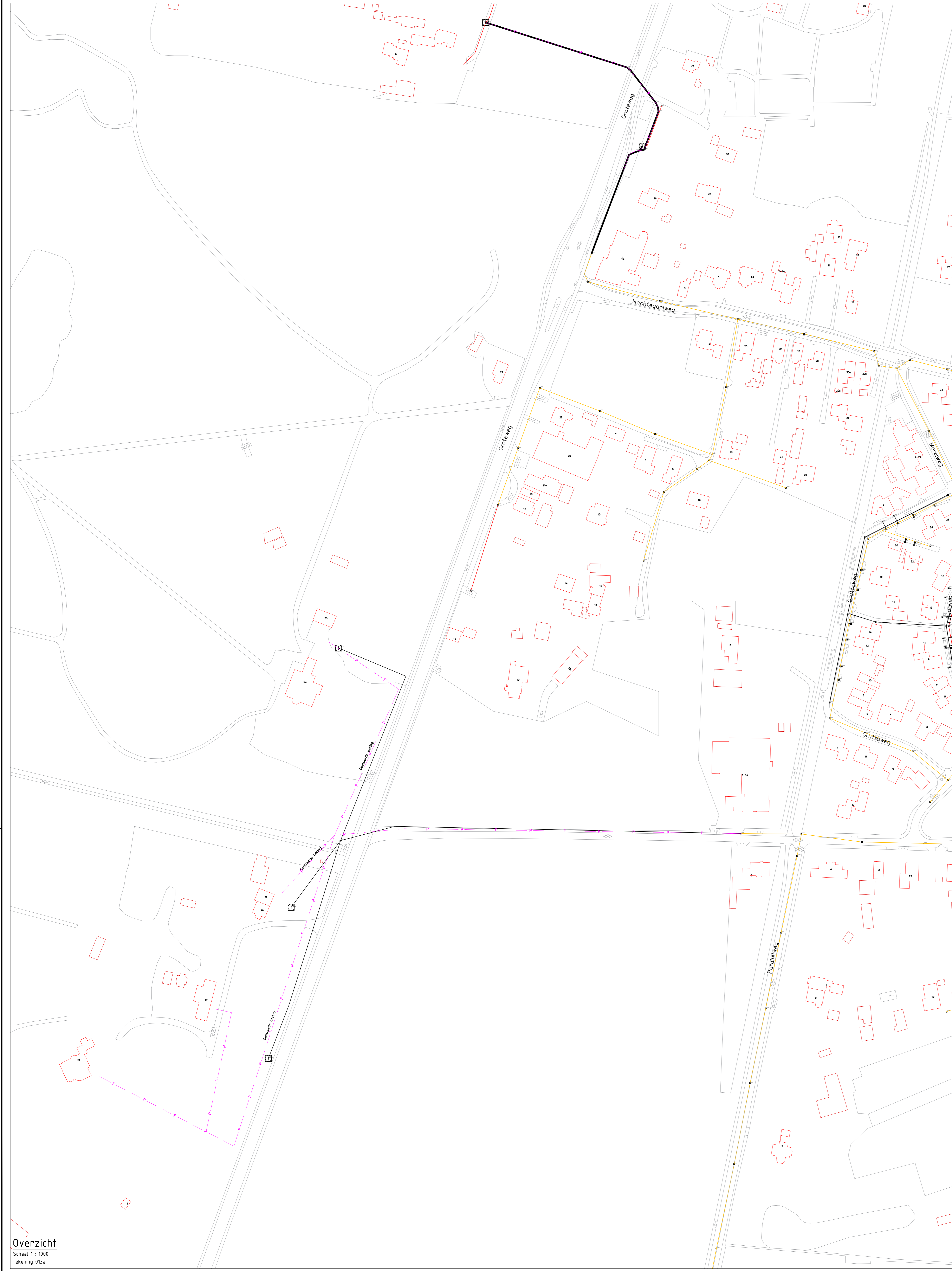
Overzicht Schaal 1: 1000 Tekening 013a